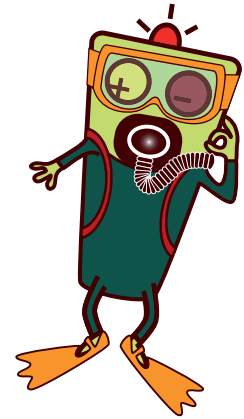
Ontwerp figuren Zapper: Fien Ternest

5 beurten aan € 25 aan de inkom van het zwembad of, op de dag zelf, kom je via de publieksruimte (naast cafetaria) bij de lesgeefster in het zwembad om een kaart te kopen. In deze prijs is de inkom voor de deelnemende ouder(s) inbegrepen. Oude kaarten blijven geldig.