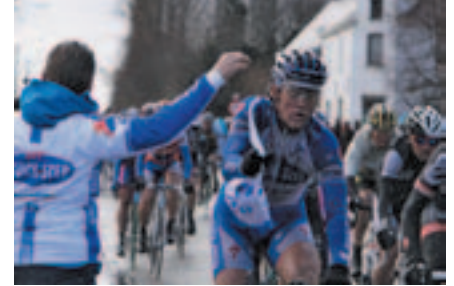
Een soigneur reikt tijdens de ravitaillering een musette aan.