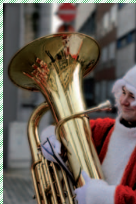
Lb, Lo: © Freddy Lepoutre R: © Joël De Jonghe