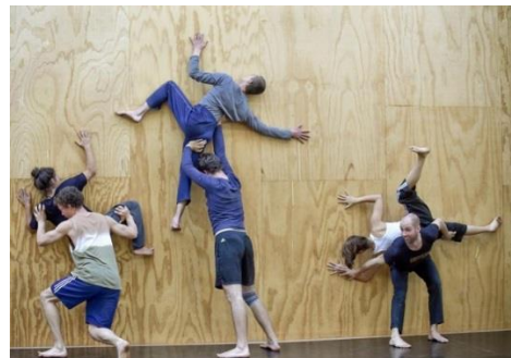
Wood Cube

Het Roeselaars Kamerkoor (CA 2016-2018) werd in 2017 geselecteerd om te participeren aan een uniek project van het Vlaamse Radio Koor. Samen met nog 14 andere geselecteerde koren mocht het RKK onder de artistieke leiding van de wereldberoemde koorcomponist Eric Whitacre zijn compositie 'Sleep' uitvoeren.