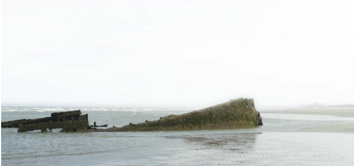
Still uit Maregrave @ Justine Cappelle

Maregrave is ook opgepikt door Argos, centrum voor kunst en media in Brussel en is getoond binnen het luik beloftevolle jonge film- en videokunstenaars tijdens het internationaal videoproject Time can Tell (Roeselare 2018) en de expo ForadCamp 2018 in Barcelona.