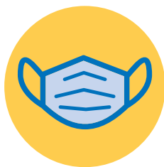
Draag altijd je mondmasker op drukke plaatsen