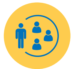
Beperk je contacten

Opgelet: ook nieuwe maatregelen zijn nog mogelijk in functie van de situatie. Alle laatste info over de coronamaatregelen vind je op www.roeselare.be/corona .