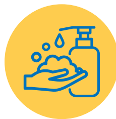
Was regelmatig je handen